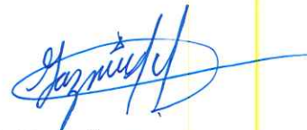
PSIC. YAZMÍN ZEPEDA MEDINA PSICÓLOGA DEL SMDIF